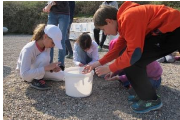
Tri des graviers