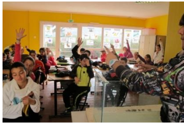
Explications de Manon