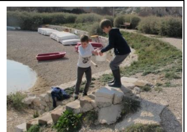
Chaîne humaine pour remplir l'aquarium en se fatignant moins ...

Au petit déjeuner, j'ai mangé des tartines avec de la confiture de fraise. Quand on a mis en place l'aquarium, j'ai aidé à faire passer les seaux vides ou plein d'eau. Pendant la séance de voile, j'ai appris à tourner, et je suis allée jusqu'à la plage Saint-Estève. Lorififi