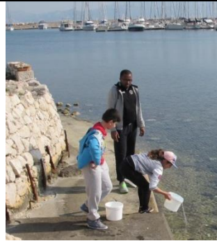
Prendre de l'eau de mer