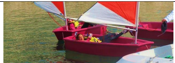
Victornade fait un petit sieston !!!

J'ai fait de la voile avec Méлина. Sur le bateau, on ne faisait que tourner dans tous les sens : c'était très rigolo. On basculait, on virevoltait, on s'essouffait. On n'en pouvait plus mais c'était génial ! Carlabyrinthe